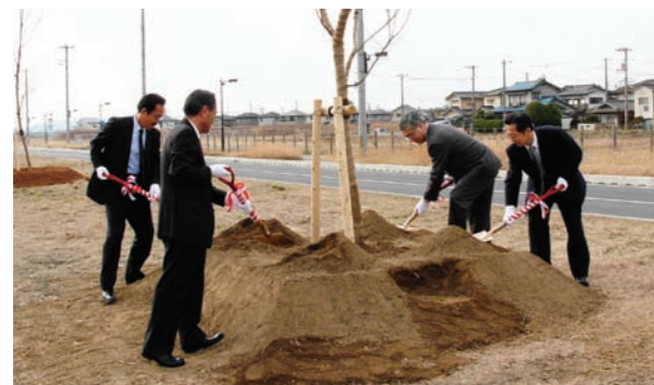
「児島湖周辺を河津桜の里に」

吉川 社外に目を向けると、好景気や市場のグローバル化等の後押しもありますが、相変わらず破竹の勢いで成長し続けている元気な企業が目立ちます。私たち DOWA グループも、時代の変化に対応し、遅れることなく事業構造改革Ⅲを推進していかなければなりません。